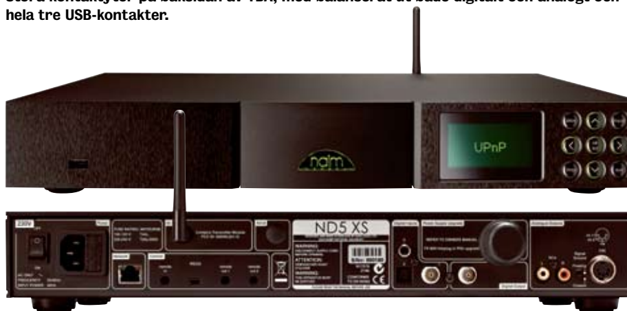
Stora kontaktytor på baksidan av YBA, med balanserat ut både digitalt och analogt och hela tre USB-kontakter.