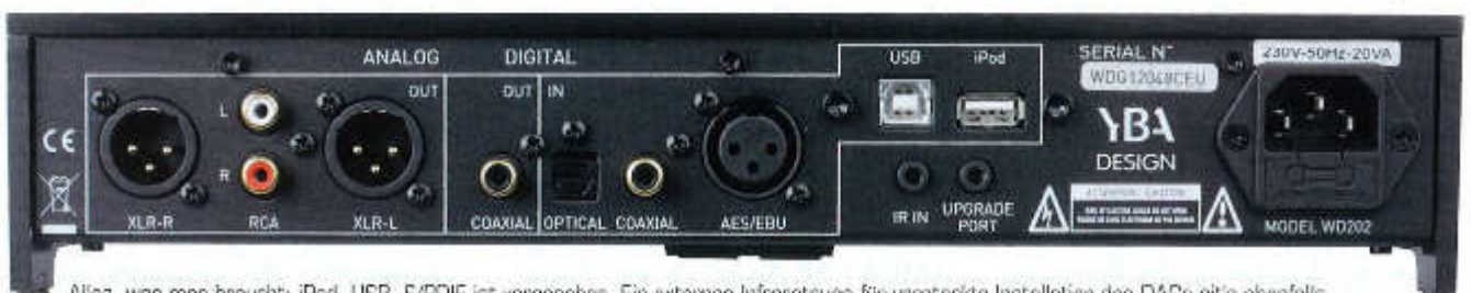
Alles, was man braucht: iPod, USB, S/PDIF ist vorgesehen. Ein externes Infrarotauge für versteckte Installation des DACs gibt es ebenfalls.