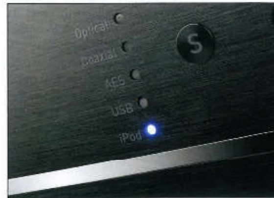
Die LED-Kette informiert über die gerade anliegende Quelle und während des Einstellens auch über den Signalpegel

Am Computer sieht auch alles einwandfrei aus. Linux und OSX erkennen den DAC sofort und zeigen „XMOSS USB Audio“ als neue Sound-