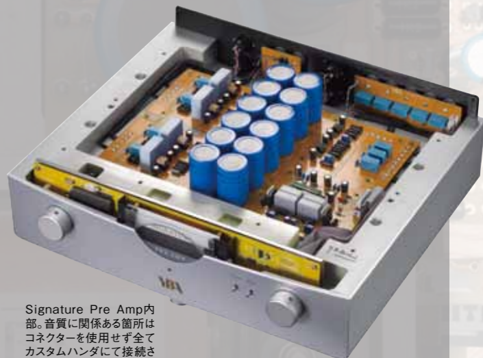
Signature Pre Amp内部。音質に関係ある箇所はコネクターを使用せず全てカスタムハンダにて接続されている