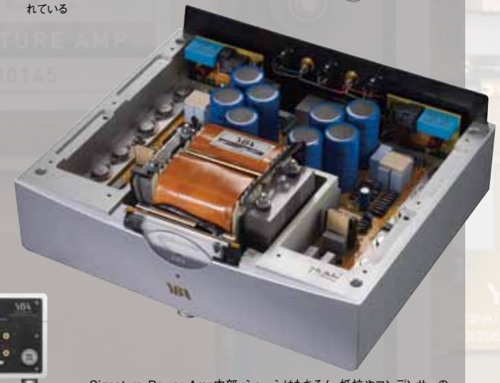
Signature Power Amp内部。シャーシはもちろん、抵抗やコンデンサの脚、ターミナル、ビスまでも非磁性体を採用し磁気歪みを追放している